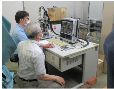
光学顕微鏡観察 (実習)