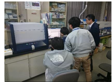
蛍光X線分析による測定