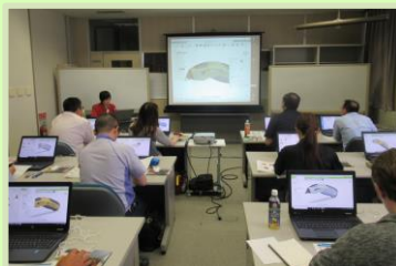
令和元年7月 CAD基礎講座