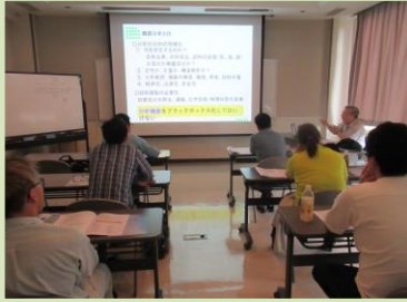
令和元年6月 分析技術基礎講座