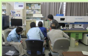
令和元年12月 分析技術実践講座②