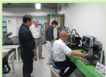
令和元年10月 分析技術実践講座①