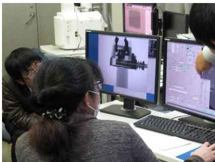
X線CTによる非破壊観察