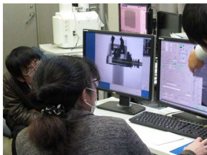
X線CTによる非破壊観察