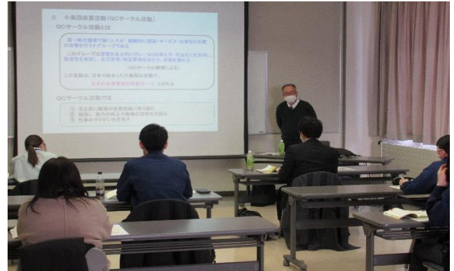
品質管理入門講座の様子

1月14・21・28日の3日間のコースで、品質管理入門講座を開催し、7名が受講しました。今回受講された方は、品質管理に関する基礎の習得を目的に参加されておりましたので、講師の先生は、基礎知識～QC7つ道具等、丁寧に講義していました。この講座は来年度も開催予定です。