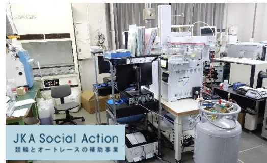
環機能応用研究室に設置したGC/MS