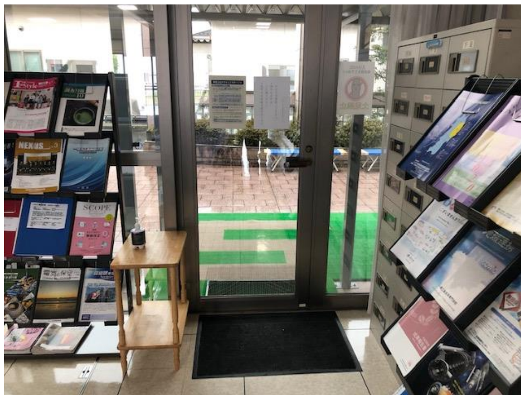
センター通用口の様子 ◀