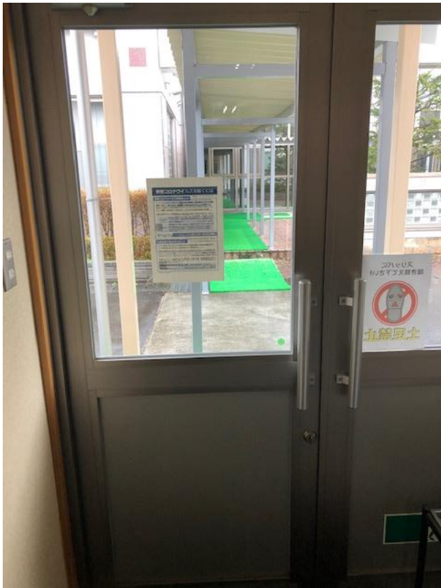
プラザ通用口の様子