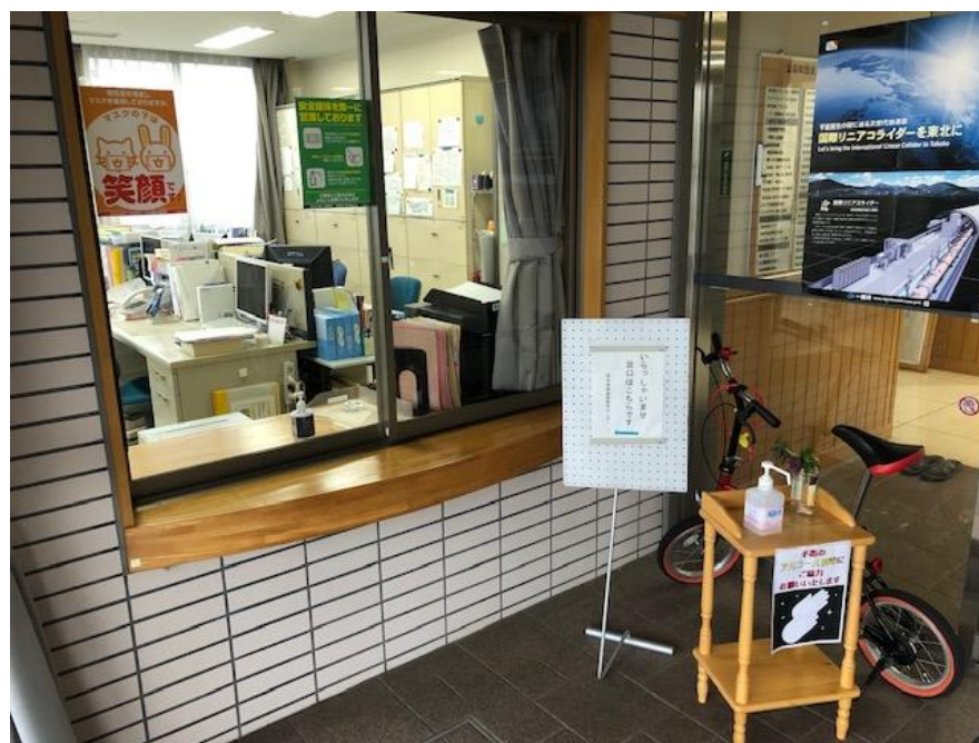
センター正面玄関玄関の様子