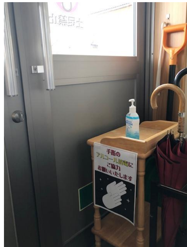
プラザ入口の様子 ◀